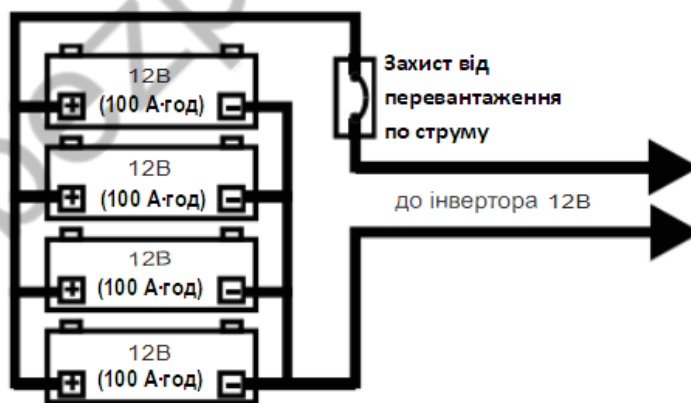
Блок акумуляторів на 12 В (загальна ємність = 400 А·год)

Для приблизного розрахунку робочого струму поділіть потужність приладів, що підключаються на 10. Якщо споживана потужність приладу дорівнює 2000Вт, то акумулятор повинен забезпечувати номінальний розрядний струм 200А. Щоб збільшити розрядний струм, з'єднайте кілька акумуляторів паралельно.