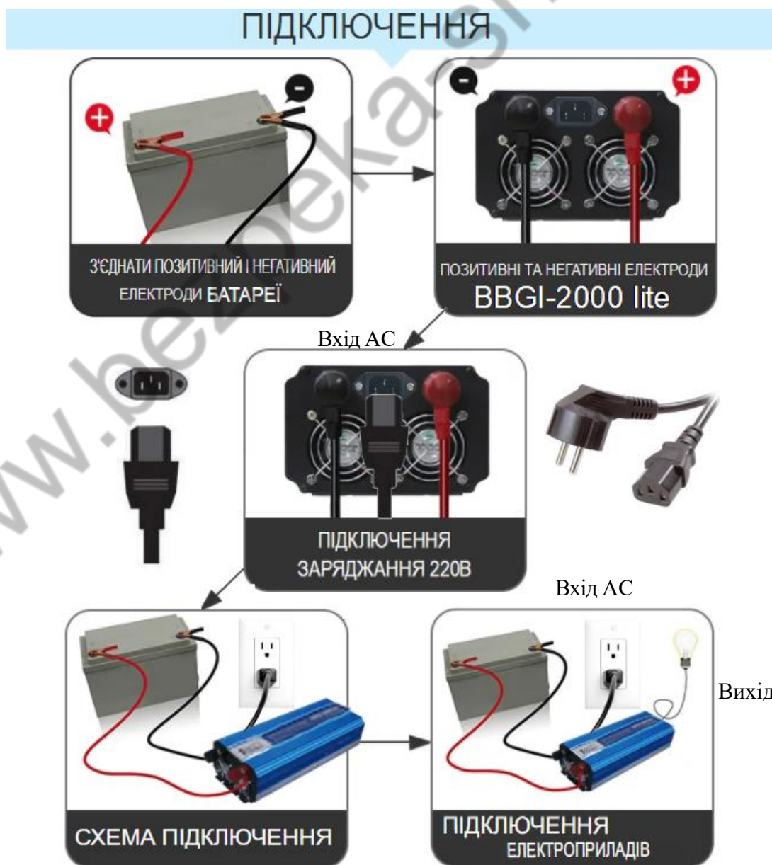
Схема підключення вказано нижче:

УВАГА! Акумулятори, що паралельно підключаються, повинні бути повністю однаковими.