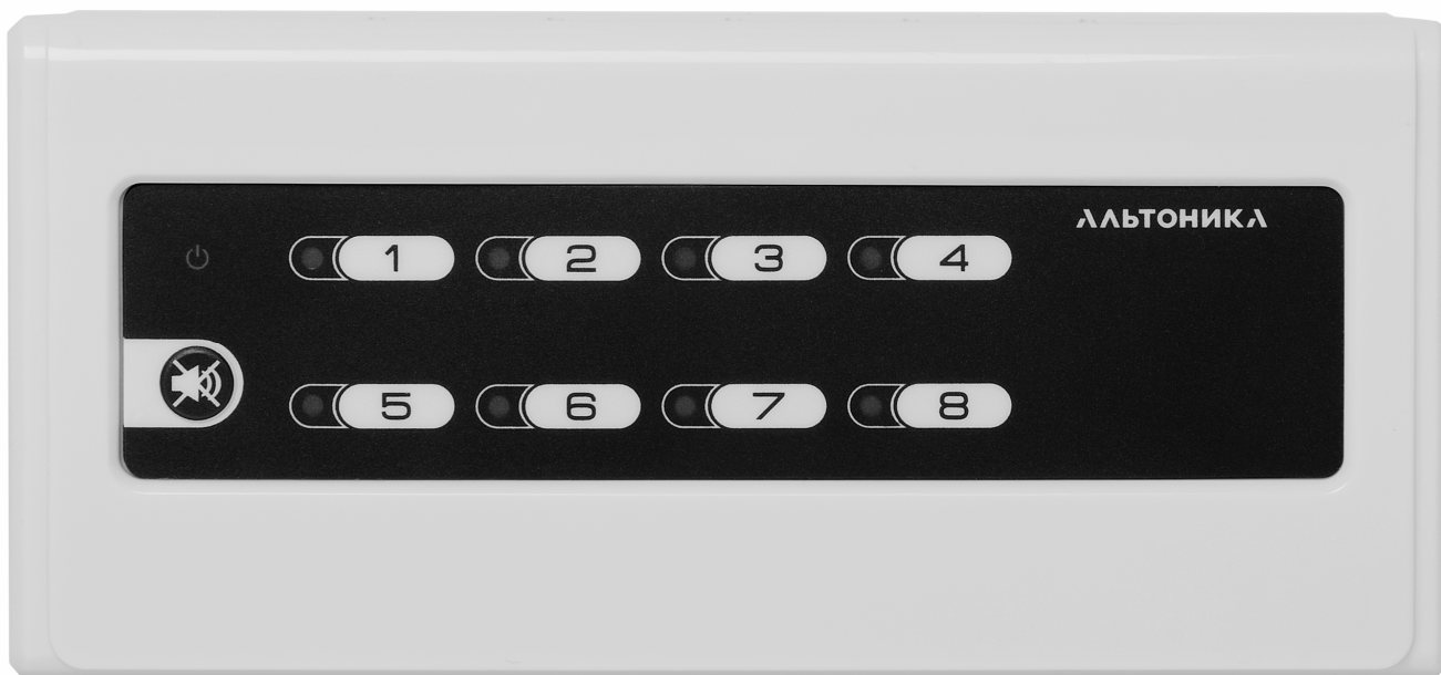
Рис. 1. Внешний вид приемника

При тревоге срабатывает реле приемника (подробное описание работы релейного выхода приведено ниже), включается звуковой сигнал и начинает мигать красный светодиод, соответствующий условному номеру передатчика, с которого поступил тревожный радиосигнал. Выключить световую и звуковую тревожную индикацию можно только посредством ручного сброса тревоги.