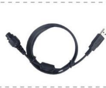
Кабель для программирования