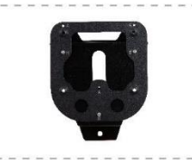
Комплект настенного крепления