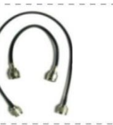
Внешний дуплексный кабель