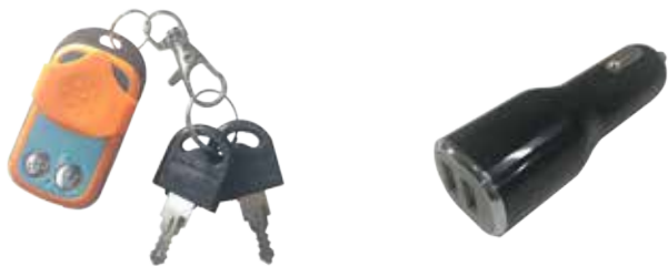
Пульт дистанционного управления и ключи Датчик