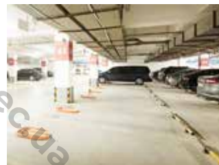
Управление парковкой в общественных местах